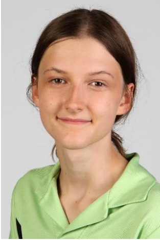
Fuhrer Naemi Fachfrau Gesundheit August 2019 – Juli 2022