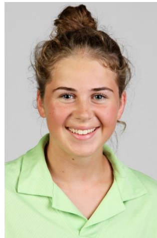
Wagner Deliah Fachfrau Gesundheit August 2017 – Juli 2020