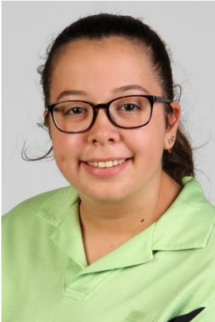
Isenaj Nora Fachfrau Gesundheit August 2018 – Juli 2021