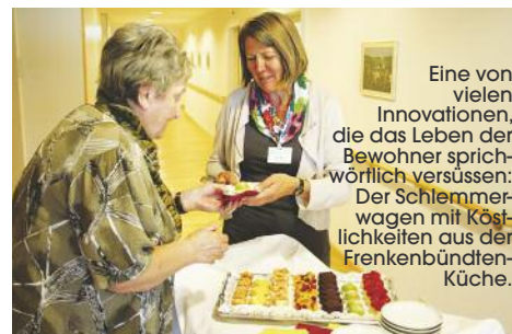
Eine von vielen Innovationen, die das Leben der Bewohner sprichwörtlich versüssen: Der Schlemmerwagen mit Köstlichkeiten aus der Frenkenbündten-Küche.

«Es ist ein Irrglaube, dass man jahrelang auf einen Platz warten muss. Wir führen eine nach Dringlichkeit geordnete Warteliste und wer dringend einen Platz benötigt, der wird auch in nützlicher Zeit einen erhalten», sagt der Heimleiter. Handelt es sich um einen Notfall, kann im Idealfall sogar