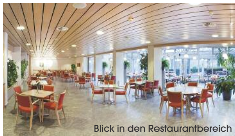
Blick in den Restaurantbereich

Das Frenkenbündten in Liestal führt beispielhaft vor Augen, dass ein Alters- und Pflegeheim alles andere als ein «Wartesaal» für Seniorinnen und Senioren sein muss. Die Pflege und Betreuung wird hier durch ein äusserst abwechslungsreiches und individuelles Programm ergänzt. Das hauseigene Restaurant mit seinen Verpflegungsmöglichkeiten zieht auch viele externe Gäste an.