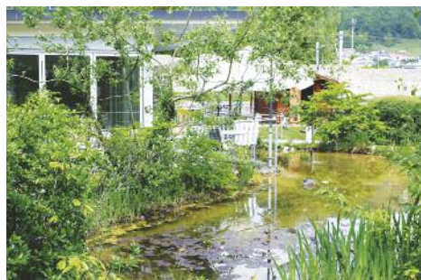
Naturaose: Auf der Rückseite des Gebäudes befindet sich ein malerischer Park mit Pavillon, Biotop und einem Ziegengehege.

mit dem öffentlichen Verkehr erschlossen und gleichwohl an ruhiger Lage, ist primär für jene Menschen da, die aus gesundheitlichen Gründen nicht mehr im eigenen Haushalt leben wollen oder können. Rund 140 Bewohnerinnen und Bewohner finden hier in Einzel- oder Doppelzimmern 24 Stunden am Tag genau jene individuelle Pflege und Betreuung, derer sie bedürfen. Das Fachpersonal und die Infrastruktur zeichnen sich speziell auch für die Betreuung Demenzbetroffener und Palliative Care Begleitung aus. Strategisch geleitet wird die Institution von einer engagierten Trägerschaft aus den neun Stiftergemeinden.