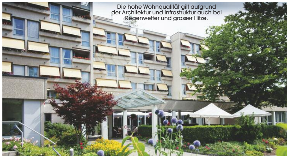
Die hohe Wohnqualität gilt aufgrund der Architektur und Infrastruktur auch bei Regenwetter und grosser Hitze.

Gitterlistrasse 10, 4410 Liestal, Tel. 061 927 17 17 info@frenkenbuednten.ch www.frenkenbuednten.ch